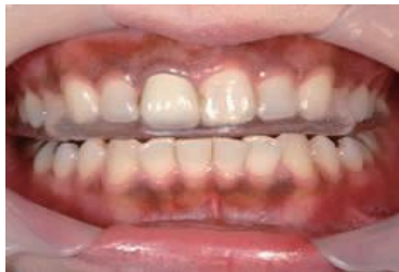
予防のためにマウスピース装着

対応: 減りすぎたところを樹脂で治したり、場合によっては被せ物を入れることもあります。進行を抑えたり、予防のために左写真のようにマウスピースを装着してもらうこともあります。