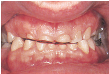
咬耗で歯が短くなった状態

病態: 硬いものを噛みすぎたり、歯ぎしりや食いしばりによって生じる歯のすり減りです。ひどくなると、歯が短くなったり、欠けたり割れたりして、歯を失うことにもつながります。