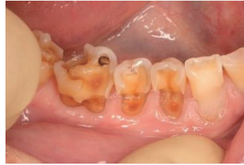
歯が酸によって溶けた状態

病態: むし歯菌が原因ではなく、酸によって歯が溶けてしまう状態です。柑橘系の果物や酸性飲食物、黒酢などの過剰摂取など、食生活を中心とした個人の生活習慣が原因のことが多く、見直しと改善が必要なが多いです。また、拒食症や逆流性食道炎といった、胃酸の逆流によって起こる場合もまれにあります。