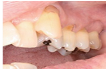
歯と歯ぐきの境目が欠けている

病態: 過剰な咬み合わせの力によって、歯と歯ぐきの境目のエナメル質や象牙質が欠けてしまう状態のことです。進行の度合いによっては、見た目や歯の寿命に悪影響を及ぼす場合があります。