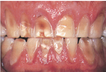
歯の表面が広く磨耗した状態

病態: 歯みがきの際に研磨剤の多く入った歯磨き剤を使ったり、硬い歯ブラシを使用することなどによる、歯の表面のすり減りです。